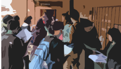
JICA教師海外研修とは 開発途上国の現状・抱える問題、日本との関係や国際協力への理解を深め、児童・生徒に伝えるプログラム。