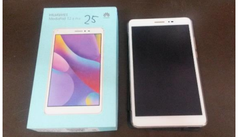
タブレットを使用したデータ収集 14名の短期在外研究員とザンビア側8名のC/P・Non C/Pが中心となつての獣医・保健・経済チームの大規模調査 in Kabwe。