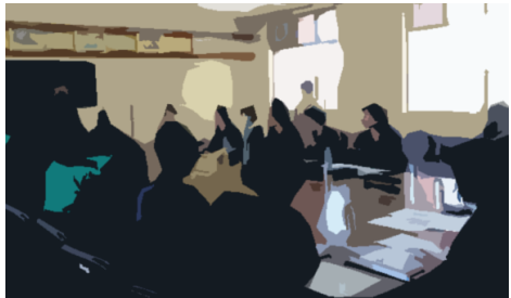
獣医学部長代理より歓迎の言葉 2017年8月9日 日本が行う国際協力の現場の一つとして UNZA獣医学部を視察。