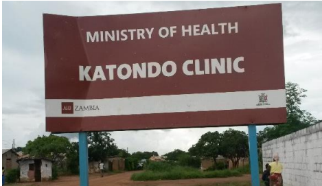
クリニックでのサンプリング Group2大規模調査：7月～9月上旬