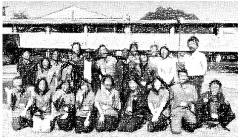
小学校から高校までの先生方 国際理解・開発教育に関心を持つ教職員。