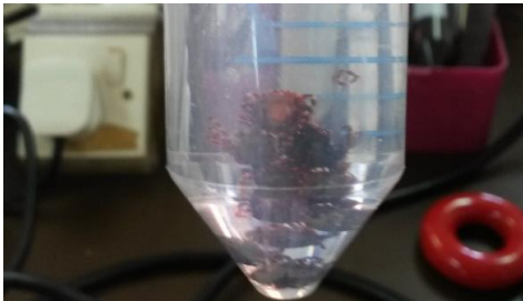
標本のダニ 獣医学部クリニック見学。