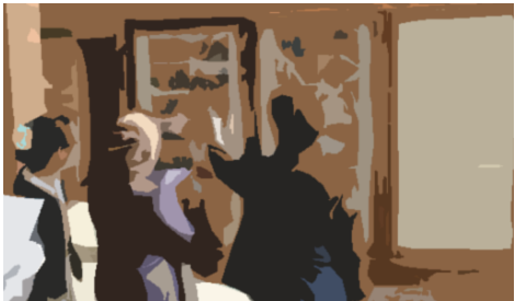
獣医学部の歴史を説明 2017年8月10日 在ザンビア特命全権大使、相馬書記官等による視察。